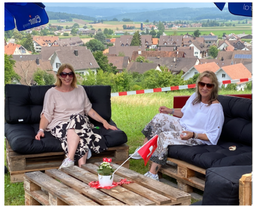
Zufriedene Organisatorinnen von STADELaktiv mit schönem Ausblick